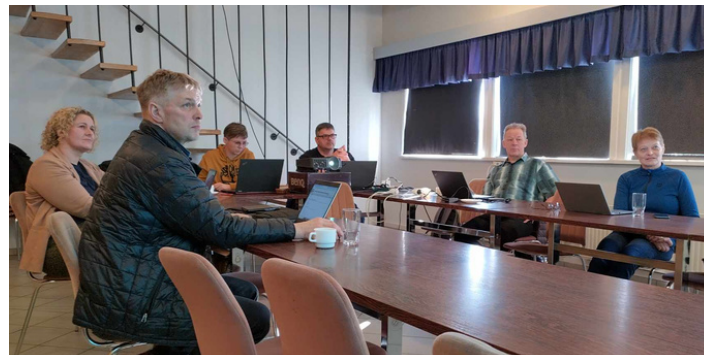
Skipulagsnefnd að störfum 20. mars

Við hvetjum íbúa og hagsmunaaðila til að fylgjast vel með þegar endanleg tillaga verður auglýst því þá gefst aftur tækifæri til að koma óskum um breytingar á framfæri, þeim óskum verður svarað með formlegum hætti.