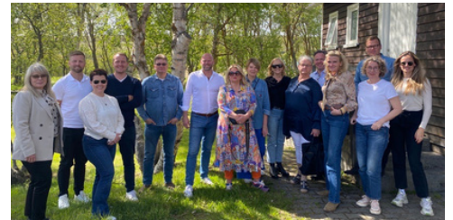
Hópurinn í blíðu við Breiðumýri

Stjórn og stjórnendur Sambands íslenskra sveitarfélaga heimsóttu Þingeyjarsveit og funduðu með sveitarstjóra og oddvita. Heimsóknin var afar góð þar sem farið var yfir tækifæri og áskoranir hjá nýsameinuðu sveitarfélagi. Gestirnir fengu líka skoðunarferð um nýtt stjórnsýsluhús á Laugum.