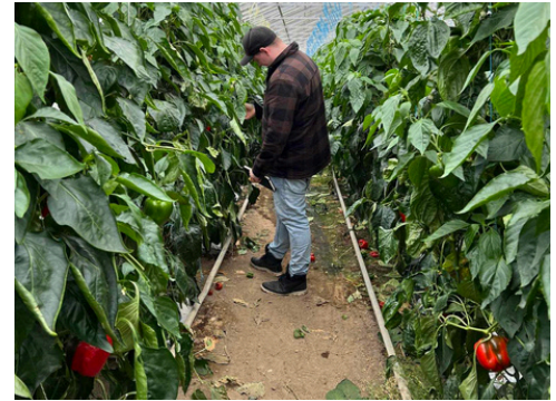
Ævintýraveröldin á Hveravöllum