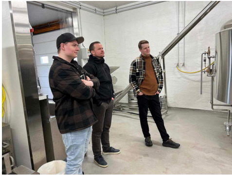
Nýtt brugghús hjá Mývatn Öl var heimsótt