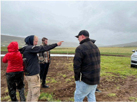
Vallakotsbændur leiðsögðu í blíðunni

Þingeyjarsveit er eins og við vitum fjársjóðskista sælkerans, og hér er mikil framleiðsla af úrvals hráefnum. Arctic Challenge hópurinn fór á flakk um sveitarfélagið í sumar, fór í margar heimsóknir og kynnti sér framleiðslu á svæðinu til að hefja undirbúning fyrir veislurnar.