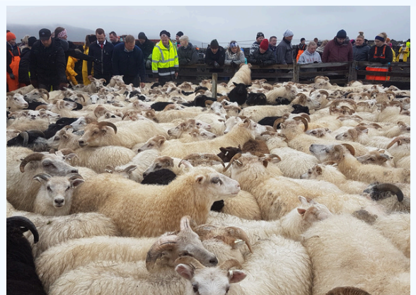
Hraunsrétt í Aðaldal