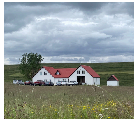
Hofstaðir í Mývatnssveit

Verkefnið er samstarfsverkefni Háskólans á Hólum, Háskóla Íslands og Minjastofnunar Íslands og markmið þess að koma á fót þverfaglegri vettvangsakademíu á Hofstöðum þar sem unnið er að rannsóknum, kennslu og miðlun menningararfs í samvinnu fornleifafraeði, minjavörslu, ferðamálafræði og hönnunar. Mikil tækifæri felast í að miðla þeim menningararfi sem grafinn hefur verið úr jörðu á Hofstöðum og gera hann aðgengilegan almenningi. Níu namar tóku þátt í akademíunni í sumar og voru þeir afar ánægðir með veru sína á Hofstöðum.