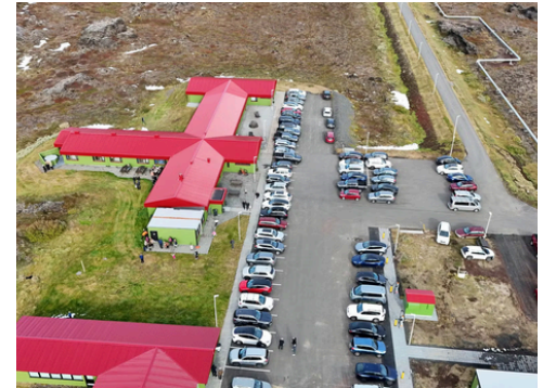
Vel mætt í Kröflu