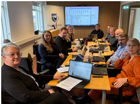
Fyrsti sveitarstjórnarfundur í nýrri aðstöðu

Fljótlega verður auglýst opið hús, þar sem íbúum gefst tækifæri til að koma í heimsókn, skoða húsið og njóta kaffiveitinga. Þá verður einnig opinberað nýtt nafn á húsinu – spennandi tímar fram undan í Þingeyjarsveit!