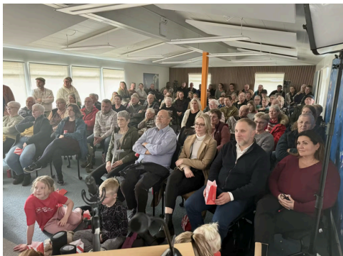
Heimsfrumsýning fyrir fullum sal