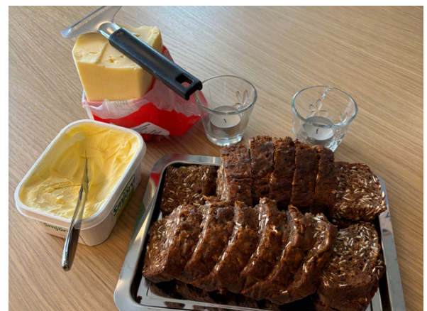
Bragðast best með miklu smjöri, helstu sérfræðingar ráðleggja smjör báðum megin.

Allt sett saman í skál og hrært vel saman. Sett í eitt smurt mót. Bakið við 200°C fyrstu 15 mín. Lækkið svo hitann í 175°C og bakið í 25 mín.