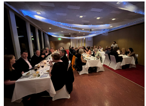
Salurinn var hinn glæsilegasti