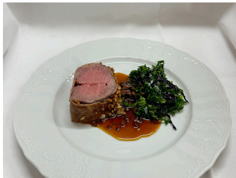
Ærfile frá Hriflu – grænkál frá Vallakoti – hamsatólgur frá Stóruvöllum