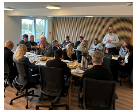
Fjölmenntur og góður fundur

Miklar umræður sköpuðust á fundinum sem var hinn ánægjulegasti. Þar fékk sveitarstjórnarfolkið okkar tóm til að ræða þau mál sem mest mæðir á. Samgöngumál vógu skiljanlega mikið og var meðal annars rætt um Bárðardalsveg vestari, neyðarveg vestan Ljósavatns, brýr yfir Skjálfandaflijt og vetrarþjónustu. Helmingamoksturinn var líka ræddur enda reglurnar barn síns tíma og mismuna sveitarfélögum. Þingeyjarsveit er t.d. með um 60% af helmingamokstri á Norðurlandi eystra sem er gríðarlega kostnaðarsamt fyrir sveitarfélagið. Skattlagning orkuauðlinda og fjarskiptasamband báru líka á góma og ljóst að þau eru mörg málefni sem þingmenn okkar þurfa að leggja áherslu á.