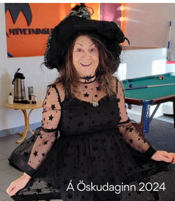
Á Öskudaginn 2024

Ásta er forstöðumaður Íþróttamiðstöðvarinnar í Reykjavíð