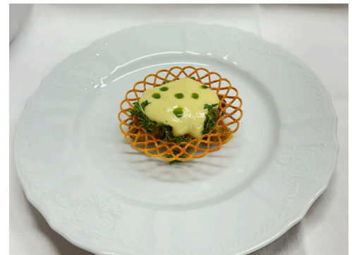
Kartöflur frá Vallakoti skessujurt – Feykir ostur – sinnepsfræi