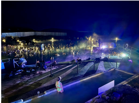
Hátt í 300 mættu á tónleika í Jarðböðunum

Til hamingju Landsvirkjun og allir sem stóðu að þessari glæsilegu hátíð!