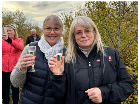
Sveitarstjórinn og fjármálastjórinn létu ekki sitt eftir liggja í Prosecco skemmtiskokki Vogafjóss.