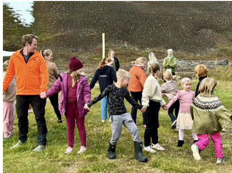
Íþróttafélagið Mývetningur stjórnaði leikjum