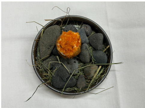
Taðreyktur silungur frá Geiteyarströnd Soðbrauð - hvönn - broddkúmen - sýrður rjómi