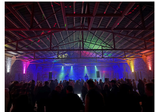
Stórtónleikar í flugskýli Mýflug Air