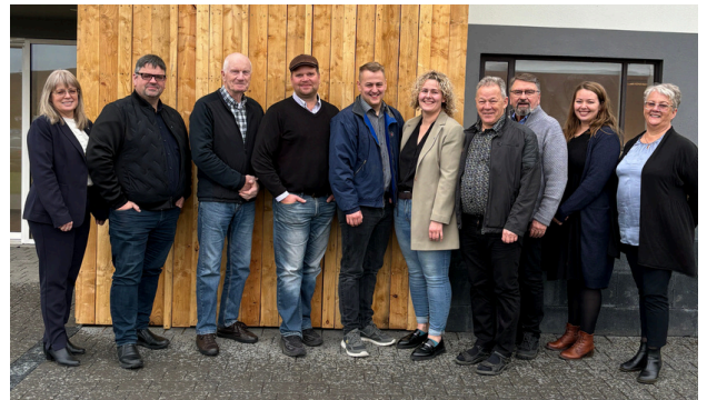
Við tilefnið var splæst í nýja mynd af sveitarstjórn

Kryddbrauð oddvitans sló rækilega í gegn í kaffiboðinu. Við leyfum uppskriftinni því að fylgja með og gefum brauðinu að sjálfsgöðu splunkunýtt nafn vel við hæfi.